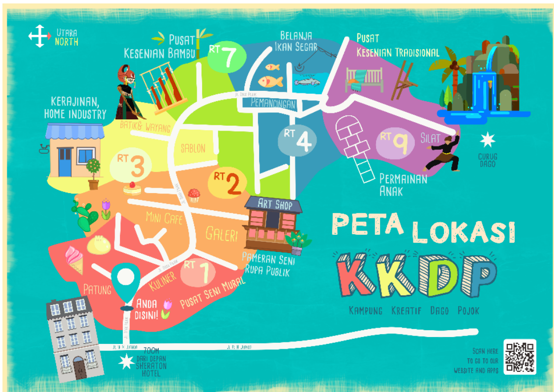
Gambar 2. Desain peta besar wilayah KKDP

Wilayah KKDP mencakup 9 RT dengan keunikan aktivitas atau kerajinan masing-masing (Gambar 1). Penulis mengelompokkan beberapa aktivitas yang bisa dilakukan oleh pengunjung berdasar kan blok warna sehingga pengunjung yang datang bisa langsung mengetahui apa saja yang ditawarkan di area KKDP.