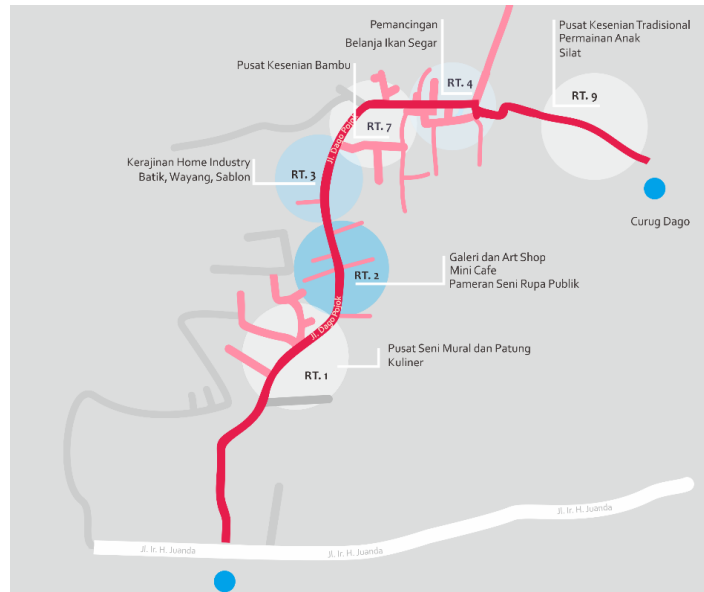
Gambar 1. Peta Kampung Kreatif Dago Pojok