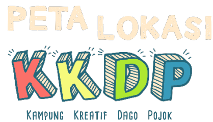
Gambar 3. Tipografi judul peta KKDP

Tipografi yang dipilih berjenis tulisan tangan agar menambah kesan kreatif dan ceria tidak kaku, selain itu dengan pertimbangan eksekusi akhir wayfinding yang berupa mural. Sedangkan untuk informasi dengan ukuran huruf yang lebih kecil, digunakan jenis huruf San Serif untuk memberikan keterbacaan yang lebih jelas.