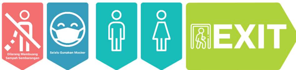
Gambar 7. Prototipe tanda larangan dan identifikasi