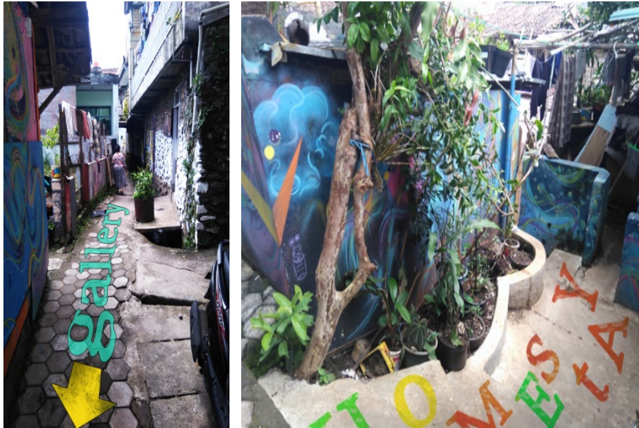
Gambar 6. Prototipe signage menuju fasilitas umum seperti galeri dan penginapan