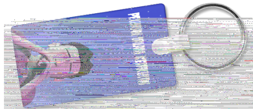
Gambar 10. Tampilan Desain Gantungan kunci

Ilustrasi yang digunakan senada dengan desain poster dari segi ilustrasi, ilustrasi diambil dari animasi 3D “Pelukan dalam Ketakutan”. Penggunaan jenis tipografi dalam judul menggunakan jenis font fancy. Bahan yang digunakan adalah akrilik.