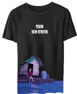
Gambar 7. Tampilan Desain T-Shirt

Ilustrasi yang digunakan sama dengan desain poster dari segi ilustrasi. Ilustrasi diambil dari animasi 3D “Pelukan dalam Ketakutan”. Warna baju yang digunakan pada desain T-Shirt menggunakan warna hitam agar dapat menggambarkan suasana malam yang terdapat dalam ilustrasi dari animasi animasi 3D “Pelukan dalam Ketakutan”. Penggunaan jenis tipografi pada T-Shirt menggunakan jenis font fancy. Bahan yang digunakan yaitu cotton 30s .