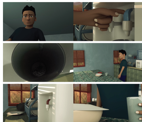
Gambar 2. Tampilan animasi 3D

Animasi 3D "Pelukan Dalam Ketakutan" adalah sebagai media utama dalam sosialisasi tentang kecerdasan emosional.