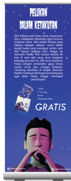
Gambar 6. Tampilan Desain Roll-up banner

Ilustrasi yang digunakan senada dengan desain poster dari segi ilustrasi. Ilustrasi diambil dari animasi 3D “Pelukan dalam Ketakutan”. Warna yang digunakan pada desain roll – up banner menggunakan warna biru selain untuk memberikan kesan ketenangan juga untuk menciptakan satu kesatuan dengan media