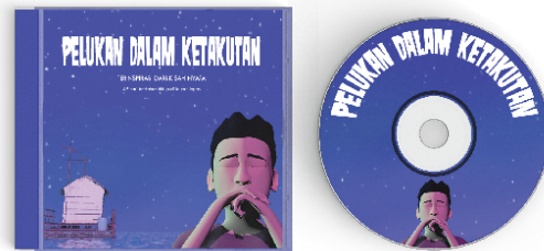
Gambar 5. Tampilan Desain Kemasan

Dalam kemasan DVD, ilustrasi yang digunakan pada desain kemasan adalah Aldi yang berpose sedang merenung memikirkan orang tuanya dan menenangkan pikirannya sambil berharap ada yang menolongnya. Penggunaan warna biru sebagai dasar untuk memberi kesan ketenangan serta penambahan warna gelap untuk menambah suasana sedih pada ilustrasi. Teks pada kemasan terletak pada bagian dalam kemasan DVD dengan memberikan sinopsis yang berisi penggalan cerita pelukan dalam ketakutan. Tipografi menggunakan jenis huruf fancy pada bagian judul.