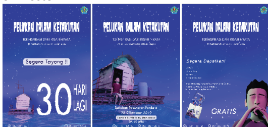
Gambar 4. Tampilan Desain Poster

Dalam poster menampilkan ilustrasi karakter beserta adegan pada saat terapung di laut. Karakter yang ditampilkan yaitu tokoh utama dalam cerita animasi. Warna yang digunakan disesuaikan dengan gaya desain yang telah ditetapkan. Secara keseluruhan warna yang digunakan dominan biru pada poster untuk memberikan kesan ketenangan. Warna yang digunakan memiliki saturasi rendah untuk mengekspresikan kesan sedih. Teks pada poster secara keseluruhan menyampaikan informasi mengenai animasi 3D yang bersifat informatif dan persuasif. Bahasa yang digunakan merupakan Bahasa sederhana agar mudah dipahami serta mudah penyampaian informasi. Unsur tipografi, menggunakan jenis huruf fancy pada bagian judul “Pelukan dalam Ketakutan”, font Tw Cent Mt di bagian sub judul, naskah dan penutup. Bahan yang digunakan untuk mewujudkan poster ini adalah art paper dengan ukuran A3.