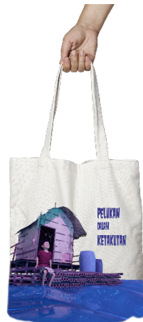
Gambar 9. Tampilan Desain Tote Bag

Ilustrasi yang digunakan sama dengan desain poster dari segi ilustrasi. Penggunaan jenis tipografi dalam judul menggunakan jenis font fancy. Bahan yang digunakan untuk mewujudkan tote bag adalah kain kanvas.