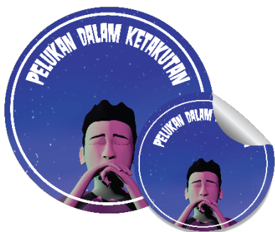
Gambar 8. Tampilan Desain Sticker

Ilustrasi yang digunakan sama dengan desain poster dari segi ilustrasi. Warna yang digunakan pada desain sticker menggunakan warna biru dan tambahan sedikit warna ungu selain untuk memberikan kesan ketenangan juga untuk menciptakan satu kesatuan dengan media lainnya. Penggunaan jenis tipografi pada