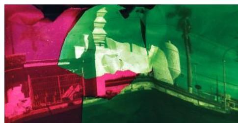
Objek foto: Pojok Beteng Kulon Kamera: Canon EOS IDs Mark III Diafragma: f/7.1 ISO: 500 Mode: Bulb Waktu pencahayaan: 361 detik