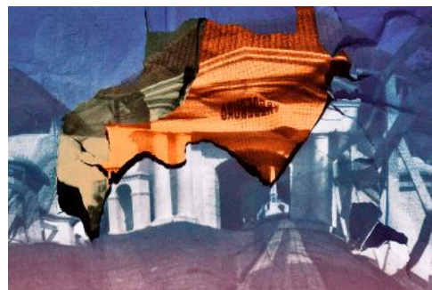
Objek foto: Benteng Vredeburg Kamera: Canon EOS 6D Diafragma: f/7.1 ISO: 800 Mode: Bulb Waktu pencahayaan: 419, 7 detik