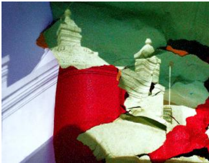
Objek foto: Pojok Beteng Wetan Kamera: Canon EOS 6D Diafragma: f/7.1 ISO: 800 Mode: Bulb Waktu Pencahayaan: 360 detik