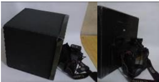
Gambar 2. Perlengkapan pemotretan

Perlengkapn lain yang digunakan dalam proses pemotretan ini di antaranya: (1) Impraboard yang berfungsi sebagai penutup dari kotak yang telah dibuat sebelumnya; (2) Aluminium foil sebagai media untuk membuat lubang jarum; dan (3) Kain hitam untuk menutup kotak dan lubang tempat lensa DSLR disambungkan agar cahaya tidak dapat masuk ke dalam kotak.