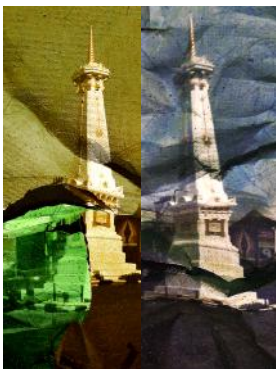
Objek foto: Tugu Yogyakarta Kamera: Canon EOS 6D Diafragma: f/6.3 ISO: 400 Mode: Bulb Waktu pencahayaan: 389.9 detik

Demikian hasil karya fotografi ekspresi yang dihasilkan dengan menggunakan teknik KLJ pada objek bangunan cagar budaya di Kota Yogyakarta. Paradoks dihadirkan lewat distorsi, noise , guratan, perspektif, dan lain-lain untuk memvisualisasikan kondisi bangunan cagar budaya yang terancam kelestariannya.