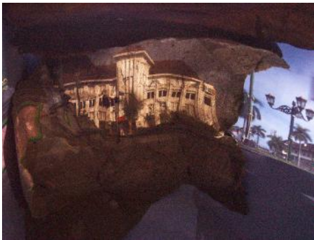
Objek foto: Eks Niil Maatschappij Kamera: Canon EOS IDs Mark III Diafragma: f/6.3 ISO: 200 Mode: Bulb Waktu pencahayaan: 551 detik