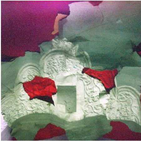
Objek foto: Plengkung Gading Kamera: Canon EOS IDs Mark III Diafragma: f/7.1 ISO: 800 Mode: Bulb Waktu pencahayaan: 300 detik