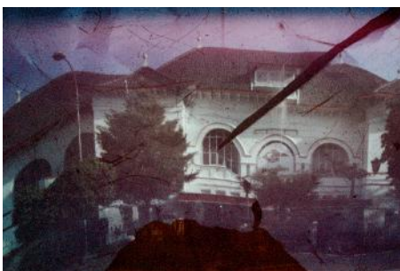
Objek foto: Kantor Pos Indonesia Kamera: Canon EOS 1200D Diafragma: f/7.1 ISO: 800 Mode: Bulb Waktu pencahayaan: 435 detik