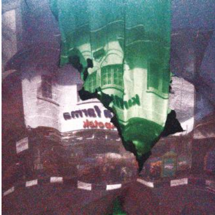
Objek foto: Apotek Kimia Farma Malioboro Kamera: Canon EOS IDs Mark III Diafragma: f/7.1 ISO: 800 Mode: Bulb Waktu pencahayaan: 390 detik