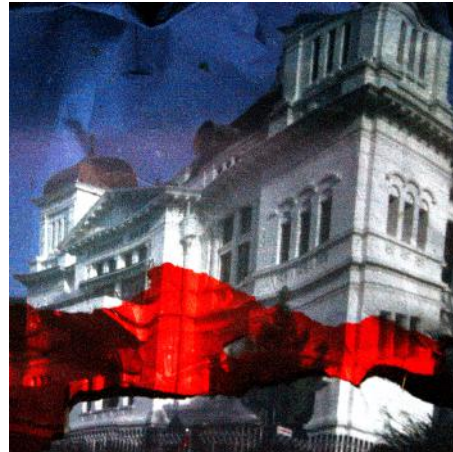
Objek foto: Museum Bank Indonesia Kamera: Canon EOS 1200D Diafragma: f/7.1 ISO: 800 Mode: Bulb Waktu pencahayaan: 359 detik